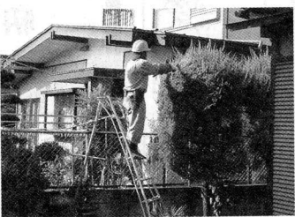
植木の剪定技術もプロ級

私は、何より体を動かしていることが大変好きなので、これからも頑張りたいと思っています」